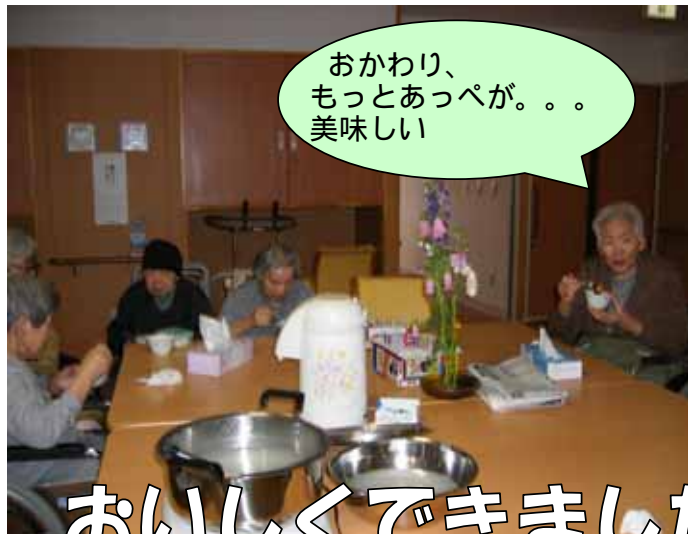
おいしくできました