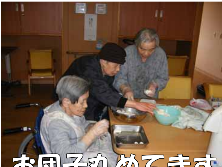
お団子丸めてます

4月から新人職員も入り、今回は『白玉ぜんざい』をつくりました。新人さんも、利用者さんに教わり、悪戦苦闘しながら白玉作りに励みました。