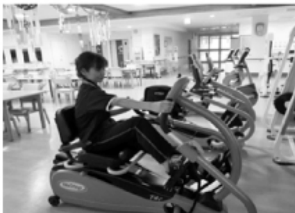
▲ニューステップ 手と足を使って全身運動ができます。

ニューステップやエルゴメーター、低周波電気治療器、ウォーターベッドも台数が増えたことでよりスムーズに行って頂くことができるようになりました。