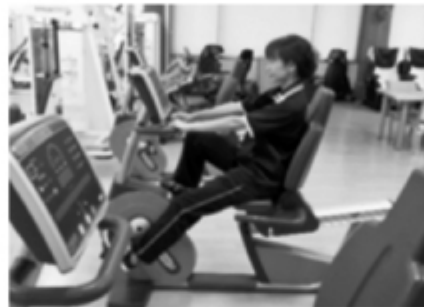
▼エルゴメーター 負荷を調整して足の運動ができます。