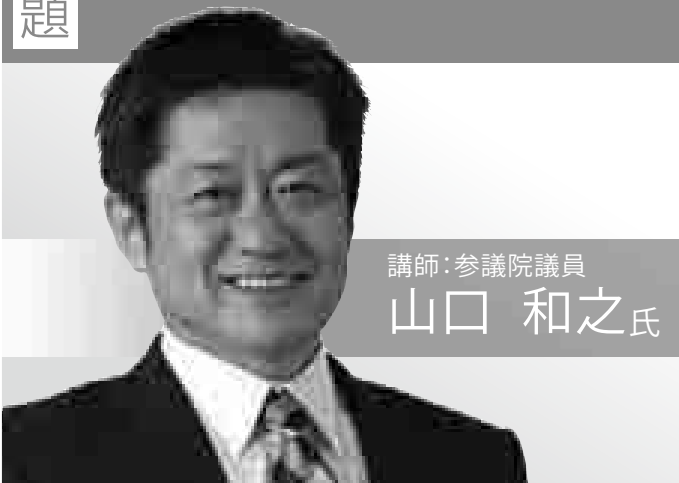
講師：参議院議員 山口 和之氏

演題 これからの医療と介護とリハビリテーション ～決め手は元気づくりと地域づくり～