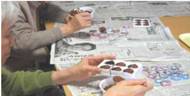
チョコを型に流します

2月14日はバレンタインデー。バレンタインにちなみ老健3階東のユニットでは、13日に手作りチョコを作りました。チョコレートを溶かして、型に流したり簡単にできるトリュフを作り、できたチョコはおやつとして皆さんで召し上がって頂きました。