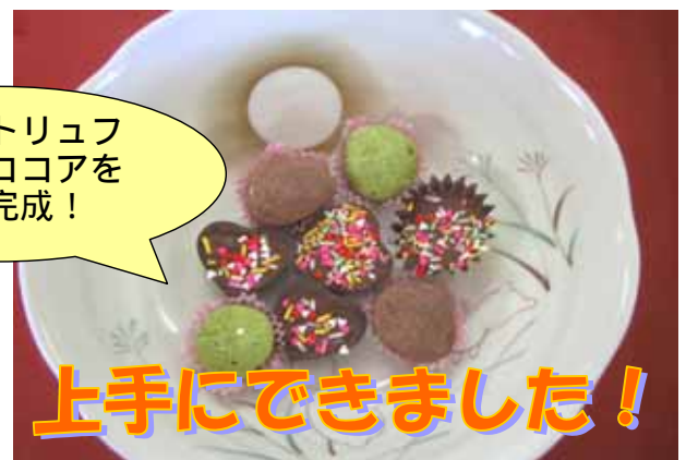
上手にできました！