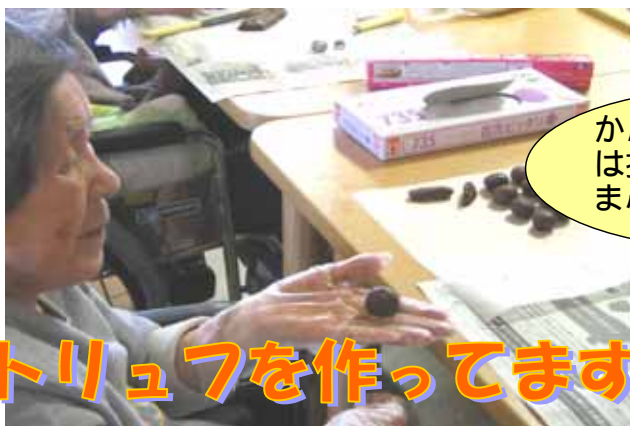
トリュフを作ってます