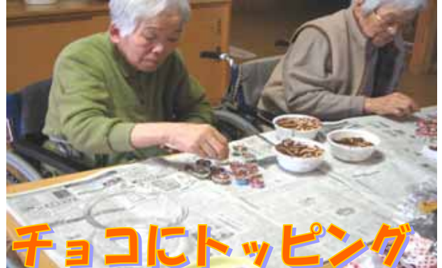
チョコにトッピング